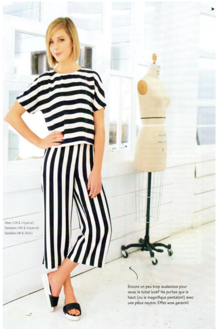
Haut (139 $, Impérial) Pantalon (195 $, Impérial) Sandales (40 $, Aldo)

Encore un peu trop audacieux pour vous, le total look? Ne portez que le haut (ou le magnifique pantalon!) avec une pièce neutre. Effet wow garanti!