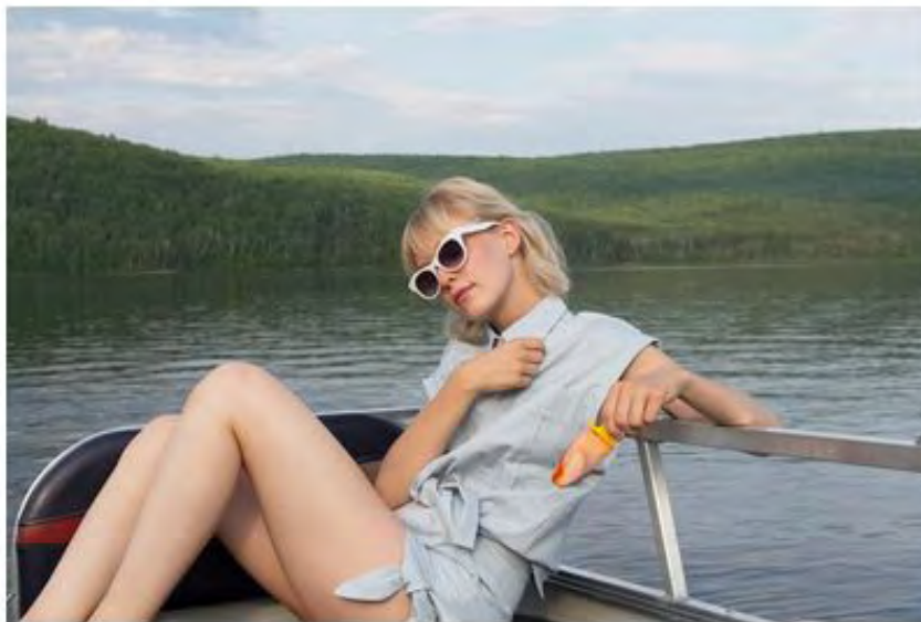
Haut et short par Eve Gravel